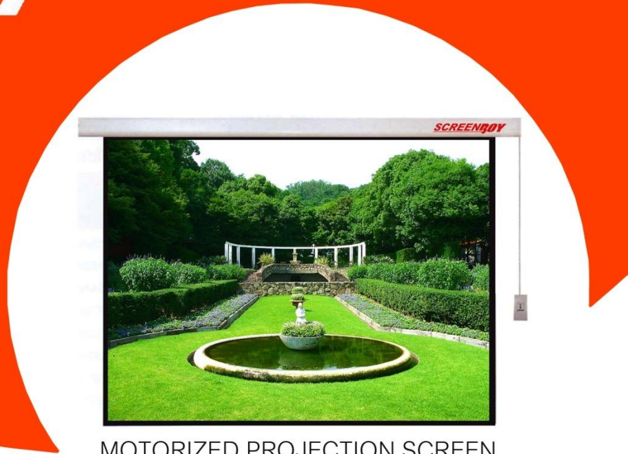
MOTORIZED PROJECTION SCREEN