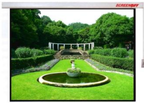
อุปกรณ์เสริม